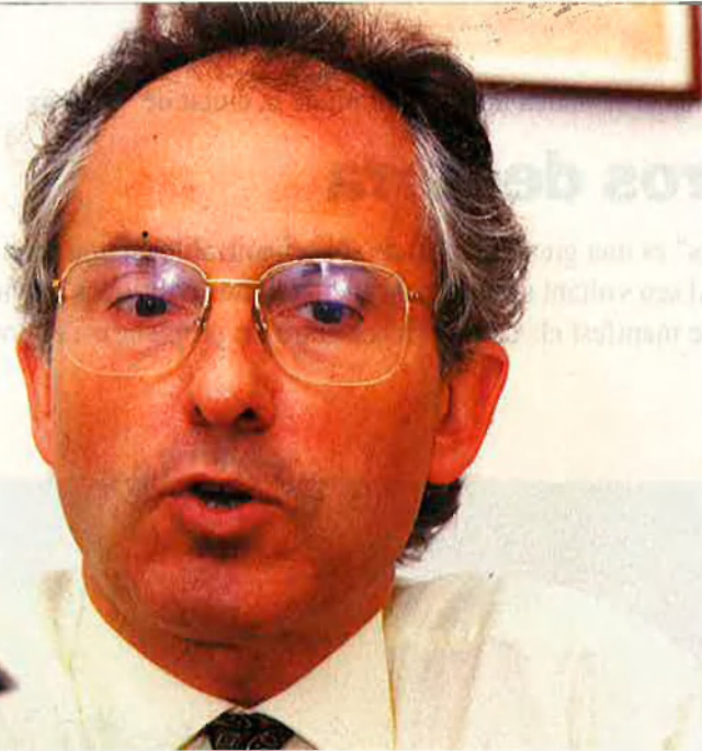
Àngel Colom, secretari general d'ERC i Rafael Ribó, president d'IC.