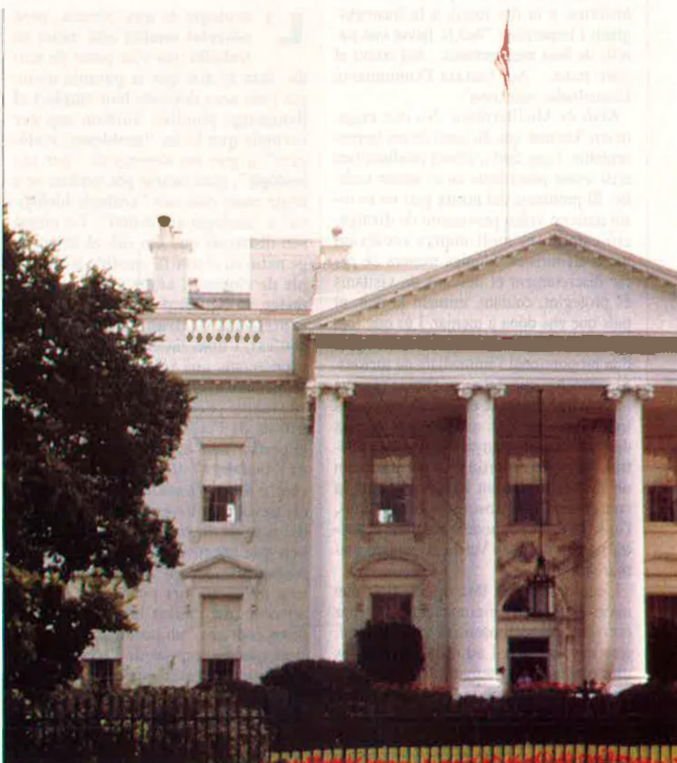
La Casa Blanca serà de nou un espai en litigi.

En 1938 Roosevelt va proposar d'anar més enllà i va demanar que les primàries fossin obertes a tota persona que afirmés que compartia la ideologia del partit. Des d'aleshores, en molts estats, ja no cal ni ser militant demòcrata per a triar el candidat demòcrata. El pas següent ja va venir sol quan l'estat de Califòrnia va aprovar una llei electoral que permetia de triar el candidat i el partit. El votant pot decidir que vol que es presente un candidat determinat i, a més, per quin dels partits vol que es presente. Això ha produït situacions com la que va portar Earl Warren al càrrec de governador de Califòrnia en 1946, sostingut i presentat, de forma simultània, pels dos grans partits.