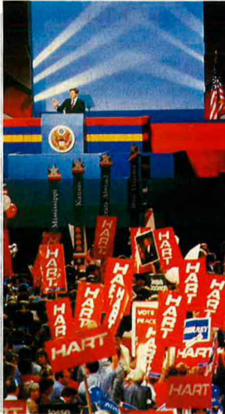
Gary Hart pagà molt car les seves aventures.

Les convencions són una barreja de votació política i espectacle televisiu i constitueixen el llançament definitiu dels candidats a president. Aquesta vegada es faran al juliol la demòcrata, a Nova York; i a l'agost la republicana, a Texas.