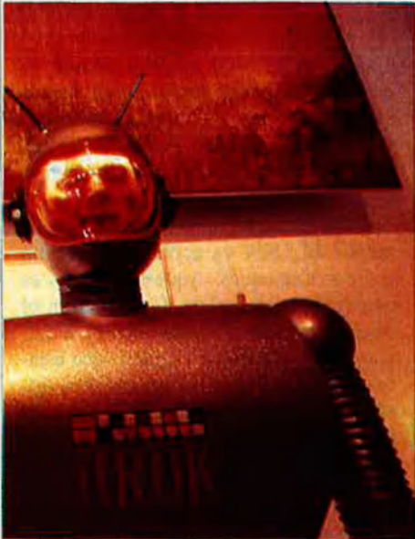
Els robots no tenen capacitat d'aprendre i adaptar-se