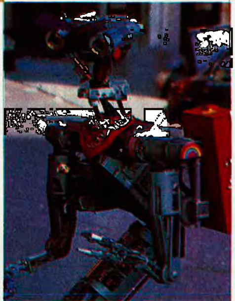
Els robots encara són màquines.