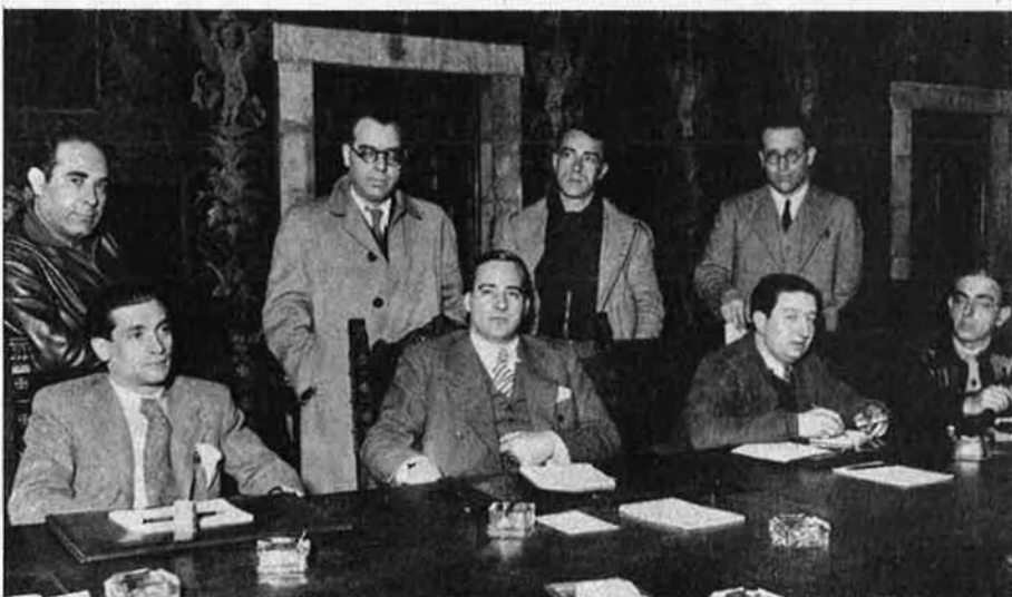
Josep Tarradellas presidint una reunió conjunta de la Generalitat i del Consejo de Aragón.

l'operació es feia des de França. Una vaga de correus de 5 setmanes l'obligà a fer un viatge amb les maletes plenes de cartes obertes, per si la duana volia veure de què es tractava. L'itinerari fou com un cercle per les zones que ajunten França, Bèlgica, Holanda i Alemanya. És a dir Brussel·les, Rotterdam, Amsterdam, l'Haia, Hasselt, Aachen i retorn a França. El resultat fou tan perfecte que més tard se n'efectuà un altre. També hi hagué una altra operació des de casa meua, a Andorra, no tan important. Andorra, amb sis parròquies, no donava per a tant. Una operació com l'esmentada en primer lloc valia un milió de pessetes de l'època, i l'ajuda que es rebia no era regular, era in-