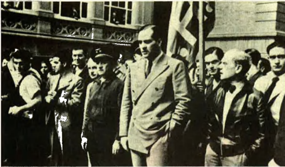
Tarradellas com a conseller d'Hisenda presidint un dol al començament de la guerra civil.