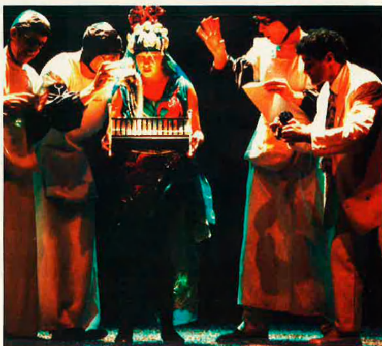
Els Comediants, responsables de la imatge de festa que ven l'Expo a tot el món.

I si en l'inici de la lluita pel control de l'Expo hi va haver un català, en l'acostament de posicions i en la pau, un català va ser l'encarregat de fer seure junts tots els que s'havien barallat. L'agost del 1991, després de la tempesta per la substitució del comissari Manuel Olivencia per Emilio Cassinello —un vice-president de l'Alto Patronato de la Sociedad Estatal Expo 92 elegit de poc—, el vice-president del govern espanyol Narcís Serra visitava Sevilla. Serra aconseguia de posar junts sense que s'esgarrapessin el comissari Emilio Cassinello, el president Jacinto Pellón, Virgilio Zapatero —ministre de Relacions amb les Corts i coordinador de l'Expo—, el govern, Manuel Chaves, president de la Junta d'Andalusia i l'alcalde de Sevilla, l'andalusista Rojas Marcos. Serra, a més, portava de Madrid el missatge que a Sevilla nou mesos abans de la inauguració, volien sentir: "no regatejarem esforços". Amunt i crits, doncs.