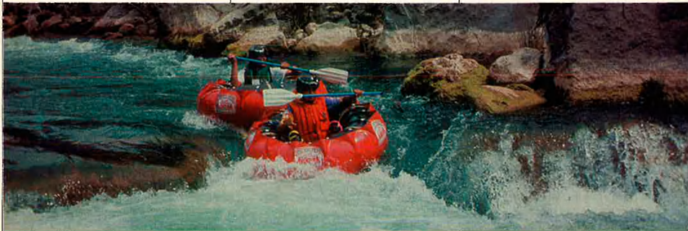
Els rius del Pirineu català, especialment el Noguera Pallaresa, són el marc idoni per a la pràctica del piragüisme i el ràfting.

El turisme d'esports d'aventura s'ha revelat com una oferta emergent i de gran expansió. Els rius del Pirineu català, especialment el Noguera Pallaresa, són el marc idoni per a la pràctica d'esports de risc com el piragüisme; el ràfting, que consisteix a baixar per rius d'aigües braves en