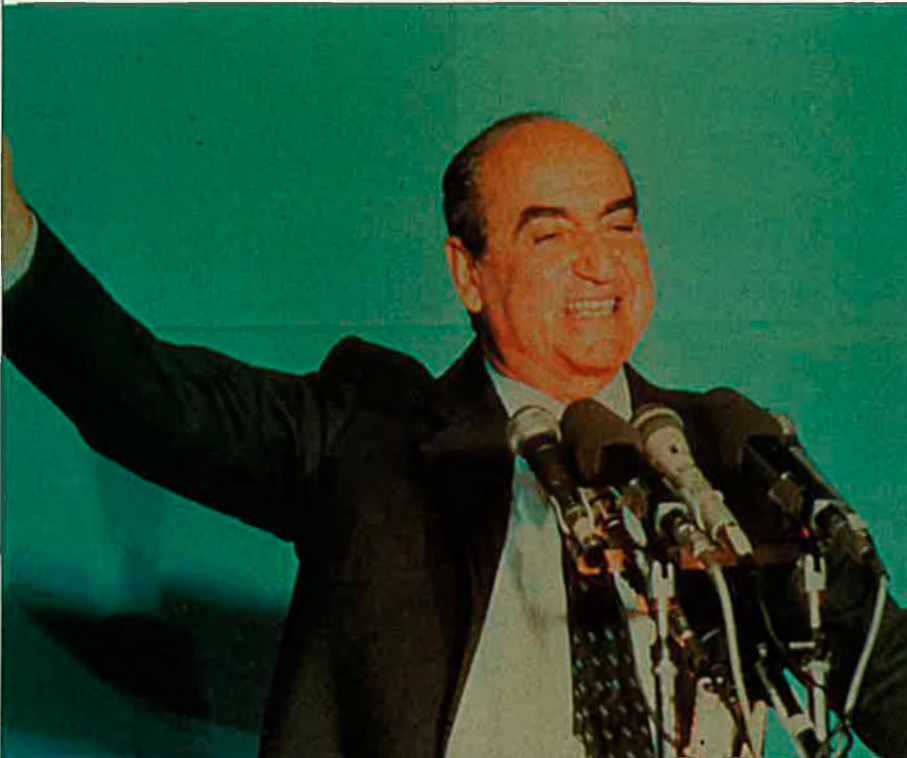
"Una part de Macedònia, el 50%, avui pertany a Grècia, una altra a Bulgària i una altra a Skopje. Aquesta és la realitat. Els estats de la CEE s'han responsabilitzat a no reconèixer aquesta república fins que no es resolgui la qüestió del nom."

mar Egea. D'aleshores ençà, Skopje no ha suspès mai la seva propaganda expansionista.