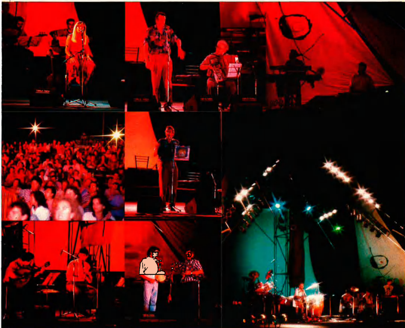
Varietat, qualitat i èxit de públic han caracteritzat el certament d'enguany de Cançons de la Mediterrània.