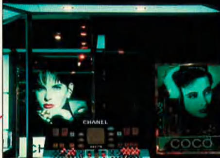
Chanel. Baix, Benetton.