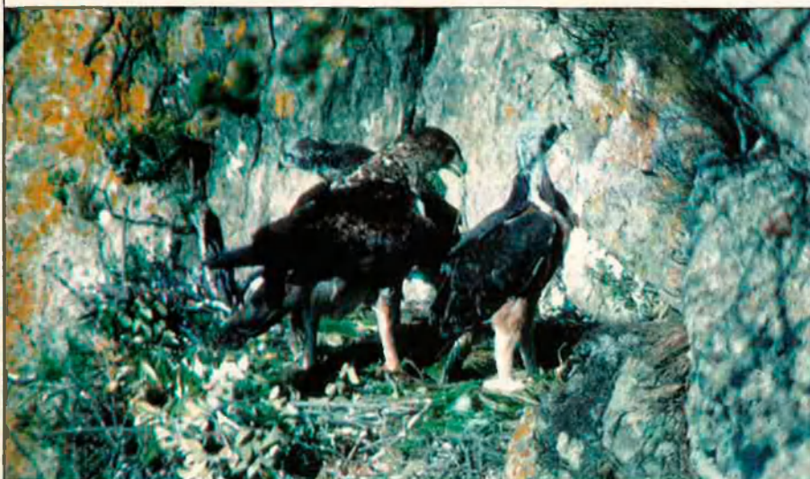
Moltes aus, com l'àguila cuabarrada, corren perill d'extinció pels paranys dels caçadors.