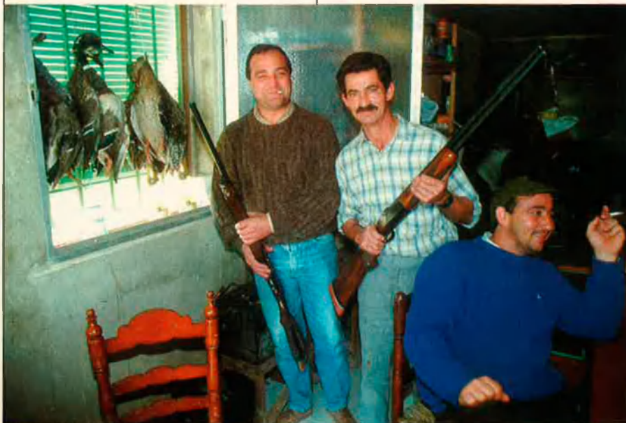
Els caçadors han de tenir una bona educació ambiental per no caure en el furtivisme.

Malgrat tot, sembla clar que les passions continuen envoltant aquesta modalitat de caça. ¿Serà suficient aquesta victòria legal per guanyar la guerra del tord? Aquesta resposta -i d'altres que envolten el món de la caça- trigaran probablement moltes temporades més a resoldre's. Desitgem que aleshores no sigui massa tard.