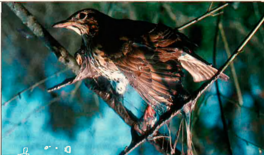
La caça del tord amb vesc és un tema polèmic.

Un sistema semblant és practicat a les Illes, anomenat "filat en coll". En aquest cas, la captura es realitza amb xarxes. L'efectivitat és també molt elevada. La SEO calcula entre 6 i 8 milions els ocells caçats, si bé no hi ha dades de les captures d'altres espècies. Aquesta temporada, però, el Govern Balear ha prohibit per primer cop aquesta tècnica.