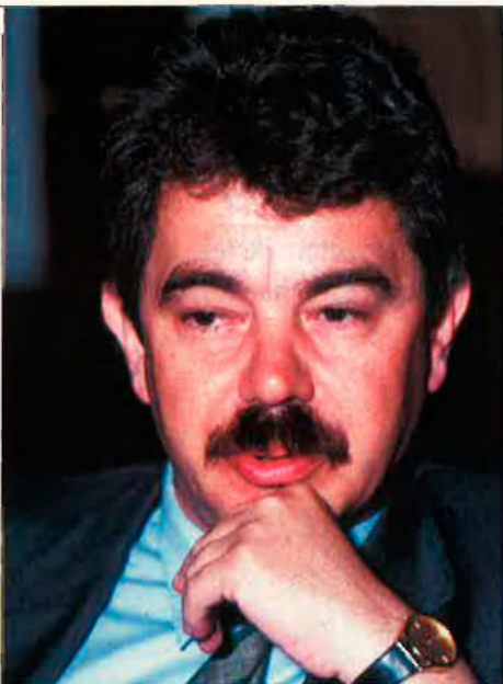
Maragall ha demanat que el COE traslladi la seu a Barcelona. D UMBERT

Sigui com sigui, ara els Jocs de Barcelona ja han passat, i amb ells també s'han esvaït les especialíssimes circumstàncies polítiques que Catalunya ha viscut durant els últims dos o tres anys. El