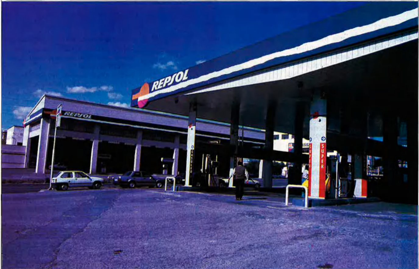
Estació de servei Sandoval, la tapadora ultra d'Alacant.