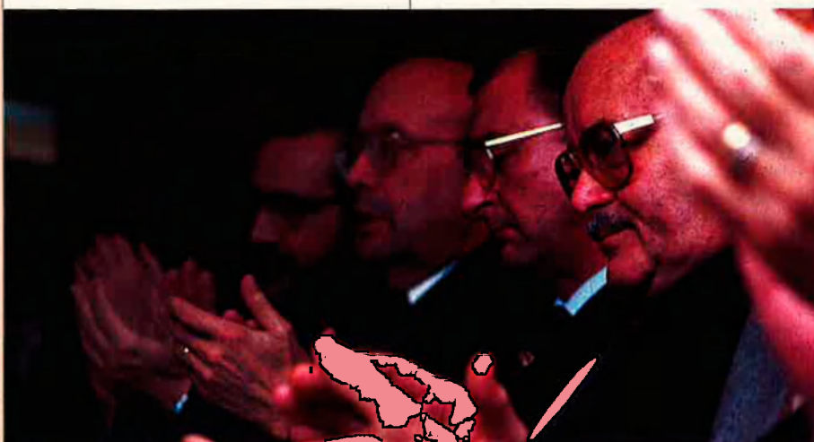
Els empresaris ja no aplaudeixen la política econòmica del govern espanyol.

La part obscura d'aquesta modalitat, segons les crítiques dels afectats, és que amb