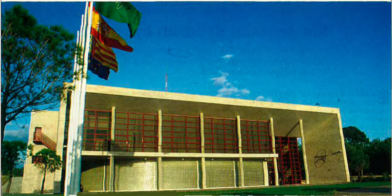
Anteriorment al Parc, existia una xarxa d'Instituts tecnològics coordinats per l'IMPIVA, amb l'ajuda de les universitats i dels mateixos empresaris.