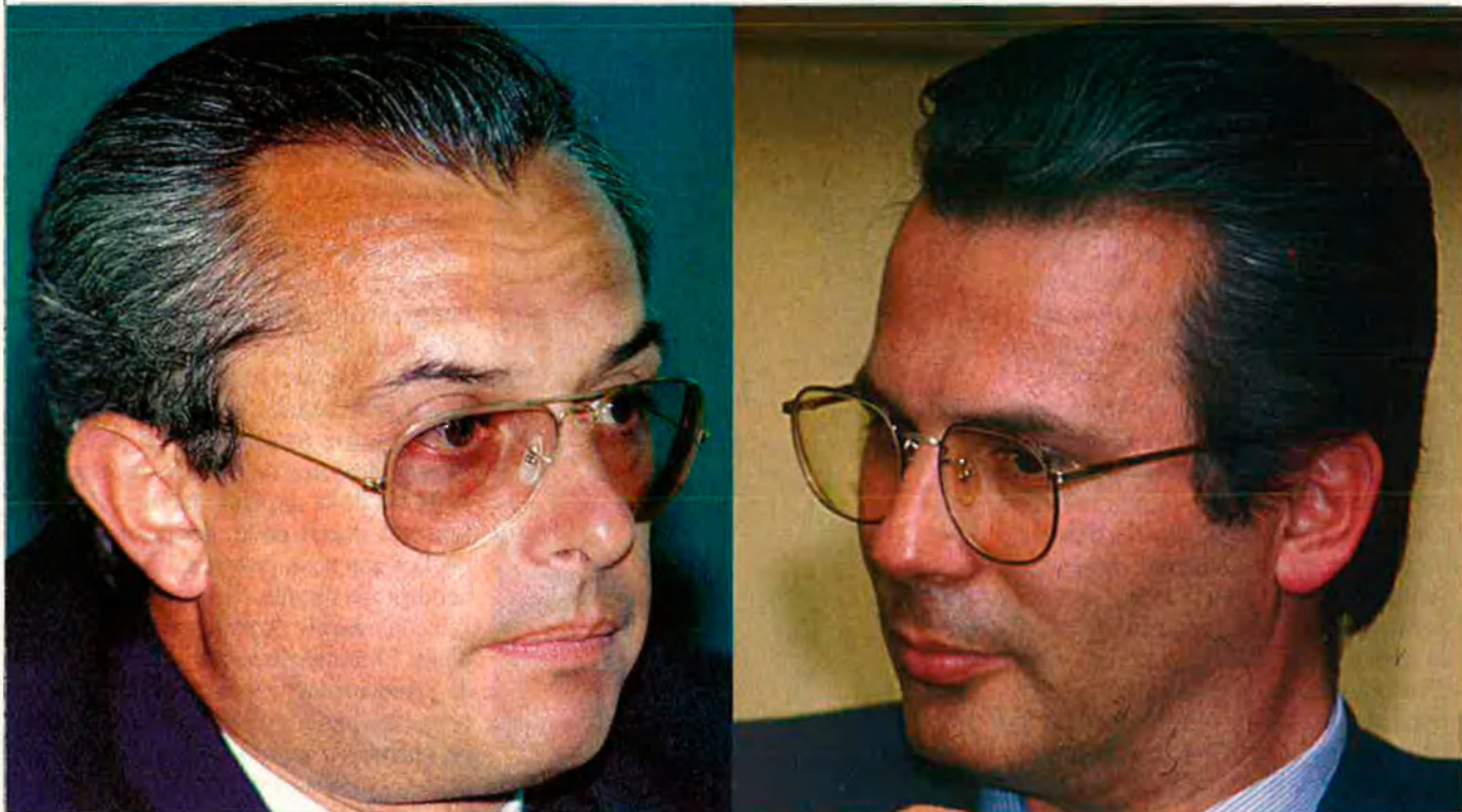
Carlos Bueren i Baltasar Garzón, els dos superjutges de l'Audiència Nacional.