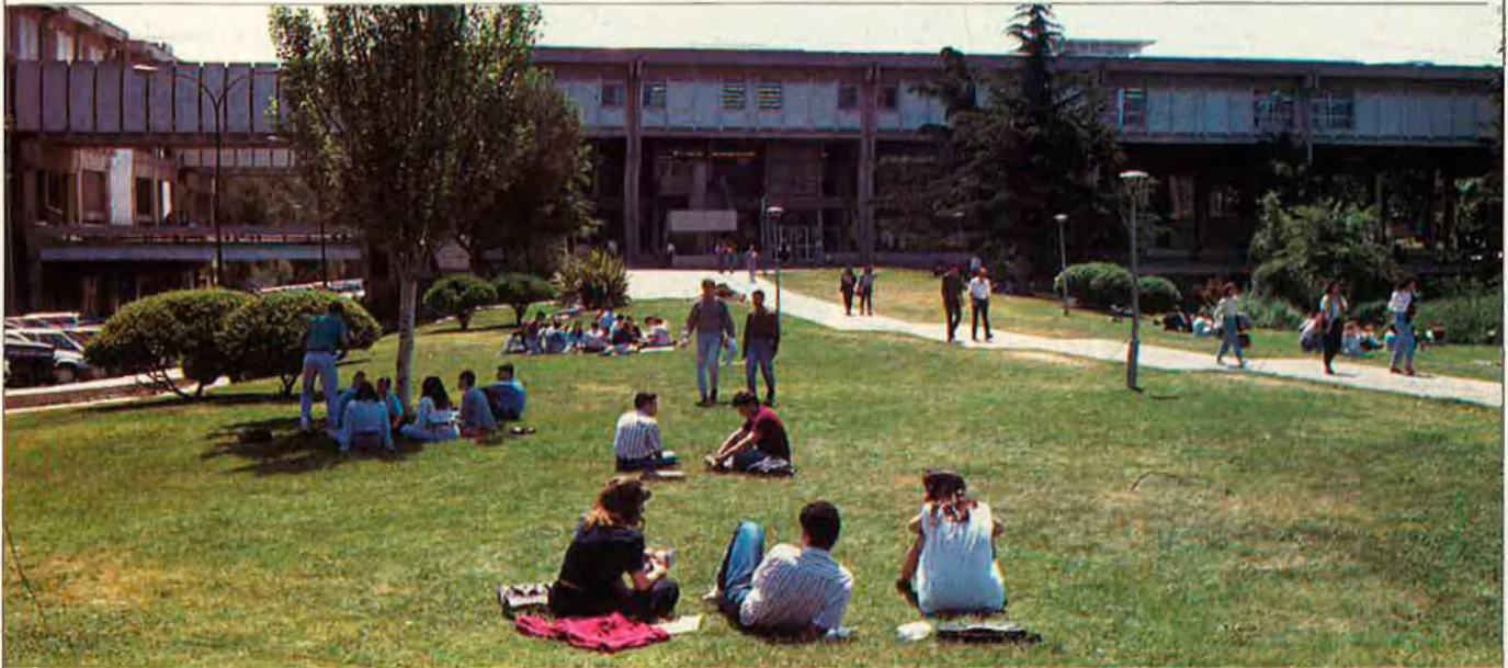
Molts estudiants, una vegada llicenciats, s'inscriuen en cursos de postgrau d'especialització de les seues respectives carreres.