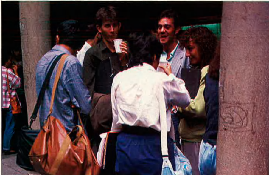
La universitat ofereix les bases, però no facilita un ensenyament pràctic i un contacte amb el món empresarial, que el màster intenta donar.