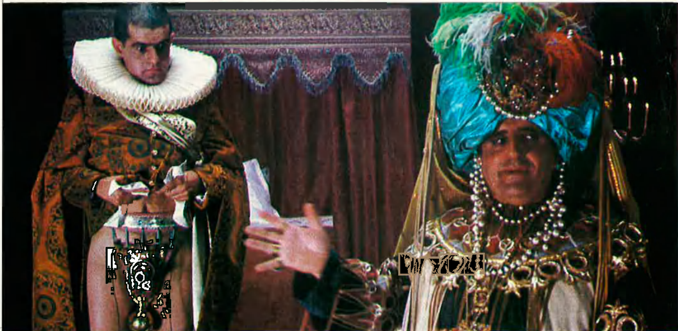
L'adjectiu mediterrani ha estat una constant a l'hora de definir el seu cinema.