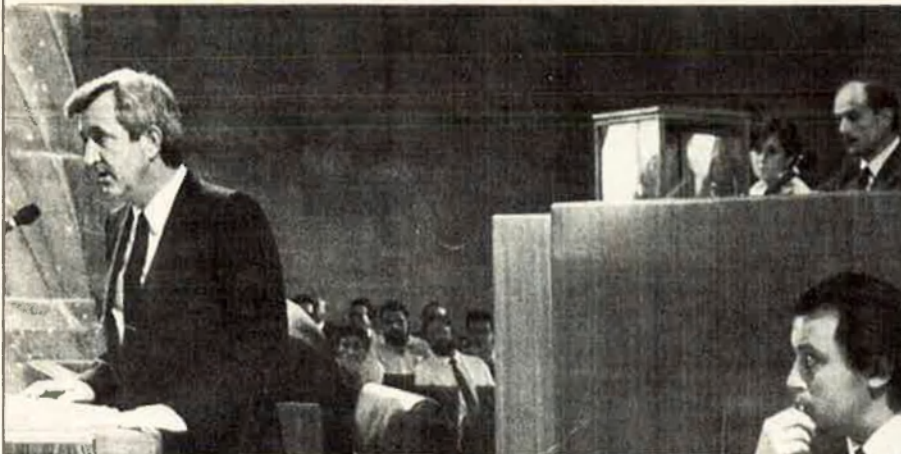
Gabriel Canellas durant el discurs d'investidura que el duria a ser president balear.