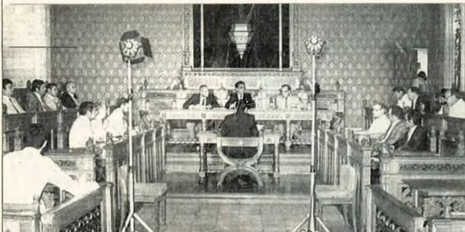
Ple del Consell General Interinsular, el 24 d'agost del 1981, presidit per Jeroni Albertí.