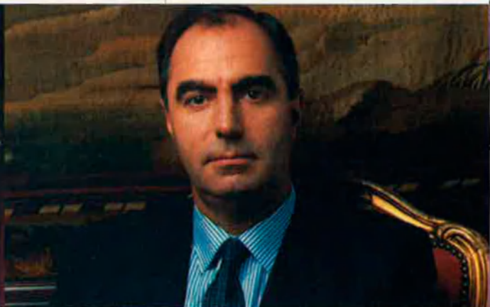
A l'esquerra, Jeroni Albertí, que començà a UCD i se n'anà d'aquesta formació el 1982 per fundar Unió Mallorquina. A la dreta, Felix Pons, derrotat a les eleccions del 1983 com a cap de llista del PSOE, posteriorment ministre d'Administració Territorial i ara president del Congrés de Diputats.