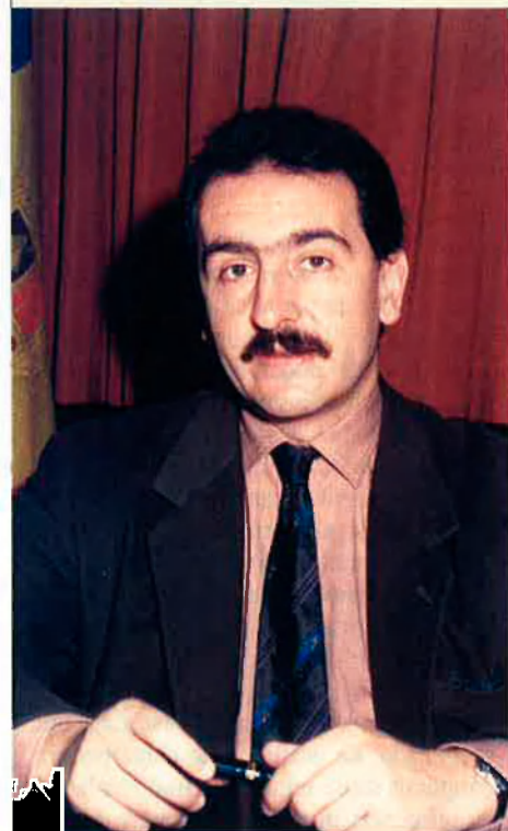
Jaume Bartumeu és un etern candidat a cap de govern.