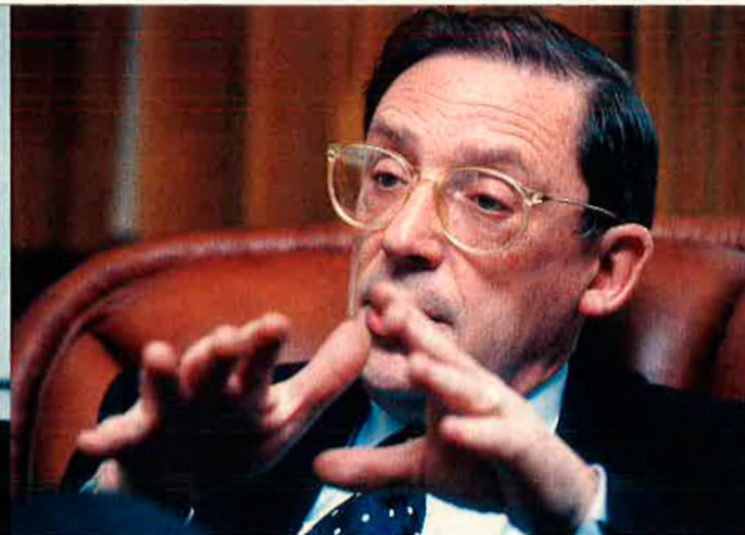
A l'esquerra, el copríncep d'Andorra i bisbe de la Seu d'Urgell, Martí Alanis. A la dreta, Òscar Ribas, actual cap de Govern.