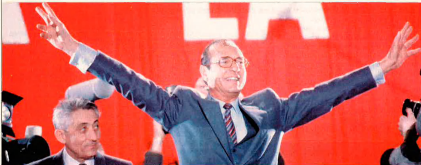
Els candidats de la dreta, com Jacques Chirac (foto), obtindran prop de la meitat dels vots i s'asseguraran la victòria.