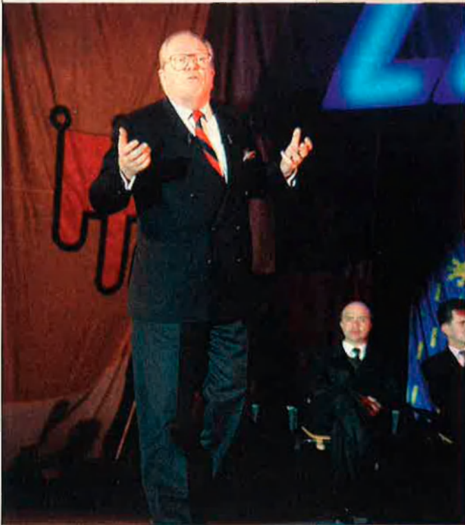
El Front Nacional de Le Pen traurà PÈRRE CODONYAN entre un 12 i un 14% dels vots.

—“Sempre, en períodes electorals, l'actual poder socialista i l'actual oposició us prometen que ho faran millor que no ho han fet abans. Però aquests dos decennis ja han demostrat que no saben frenar la desocupació, la inseguretat, la invasió del nostre país pels emigrants, la inquietud que tots sentim pels nostres.”