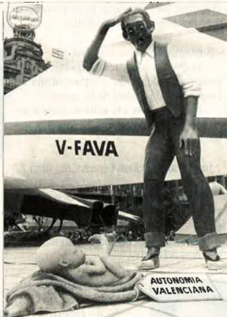
L'autonomia sorprenia València i irritava el món faller, que hi veia competència en la seua defensa del valencianisme.

La situació no ha variat gaire en els últims anys. El desinterès en el món intel·lectual és encara majoritari. L'estudi