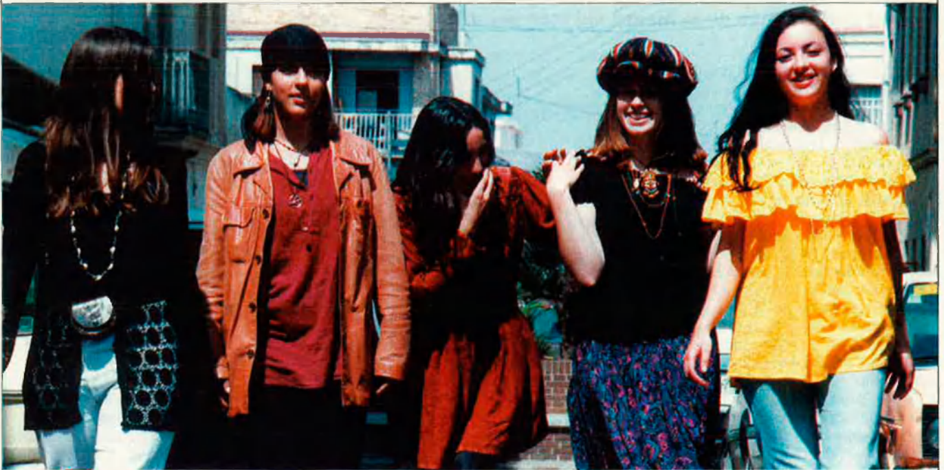
La joventut d'avui opta pel silenci.