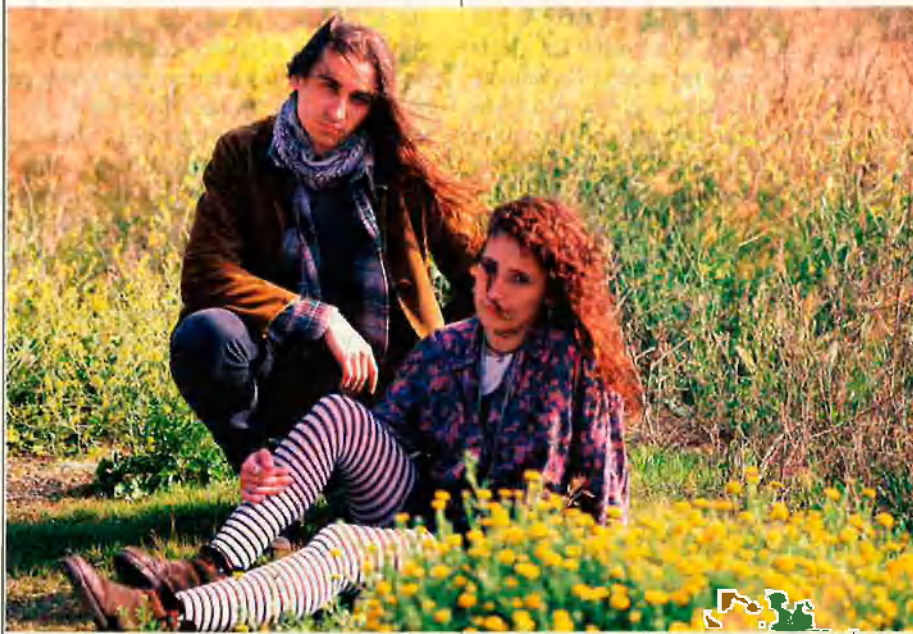
El fenomen grunge va sorgir als Estats Units, a la ciutat de Seattle, i s'ha estès ràpidament.

D'altra banda, si els seus primers passos s'iniciaren al marge de l'àrea d'influència del consumisme, ràpidament aquest va saber copsar allò que més captiva la gent: l'originalitat. I ara no ha tardat a nàixer un circuit paral·lel, un mercat de roba de segona mà en què l'extravagància dels preus contradiu l'aparent marginalitat dels compradors. Tampoc no ha tardat, l'elit dels dissenyadors, a perfilar un prêt-à-porter pseudo- grunge amb l'empremta, camuflada, de la marca. I en aquest punt de la moda, un es pregunta: ètica o estètica en una presumpta antimoda en què descosit, descolorit i esgarrat són les constants de la seua identificació?