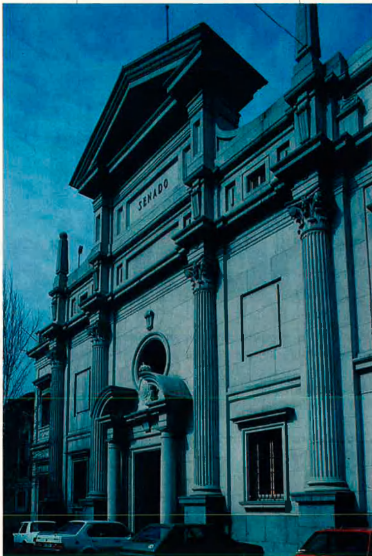
La reforma del Senat espanyol està aturada.

En segon lloc, els programes electorals de les dues formacions polítiques majoritàries, PSOE i PP, no recullen la totalitat de l'acord signat. Òbviament, el PP n'està molt lluny. El seu programa recull només la voluntat de "reforçar" el Senat com a cambra de representació territorial. Però el programa del PSOE no fa tampoc una referència explícita a l'acord. Tot i manifestar la voluntat d'"adequar el Senat a la nostra estructura territorial", no concreta més, excepte que la reforma no ha d'excloure "la possibilitat de procedir a una reforma consensuada d'algun precepte constitucional". El programa afegeix només que es considera "positiu" que la reforma inclogui "fórmules" encaminades a facilitar l'encontre dels pre-