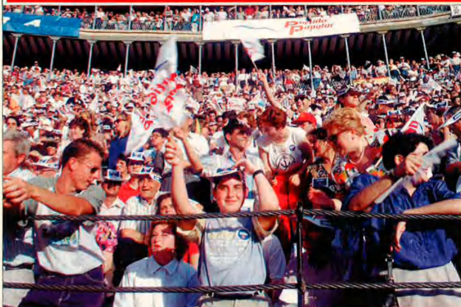
La demostració de força del PP a València en el míting de campanya feia pressagiar una victòria clara.

això és clar, el PSOE continua sent la primera força política. Perd 15 diputats, però manté una hegemonia sobre la resta de partits amb la qual pot jugar a l'hora de cercar garanties de governabilitat estable. Els socialistes van apostar per la figura de Felipe González durant la campanya i els resultats els han donat la raó, en aquesta aposta. Han evitat la desfeta absoluta que alguns pronosticaven —recordem que després del primer debat cara a cara entre Felipe i Aznar, els sondejos parlaven d'avantatge popular— i surten reforçats.