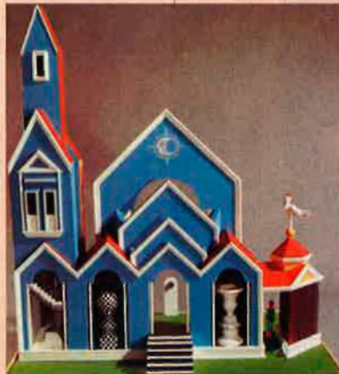
Primer premi 1990, Jocs visuals, foc per als ulls , de Miquel Àngel Guillén Romeu.

quasi constants. Fins i tot ignorant totalment el dissenyador amb qui s'havia contractat el compromís de materialitzar el projecte. Sens dubte els efectes d'aquesta mancança de contactes i seguiments del treball no han beneficiat precisament l'èxit de l'experimentació projectada, i s'ha donat més d'un cas d'irregularitats i diferències constructives en relació amb la plasmació fidel del projecte premiat. Un fet que, sense dubte, serà necessari corregir amb vista al futur de les mateixes fogueres experimentals.