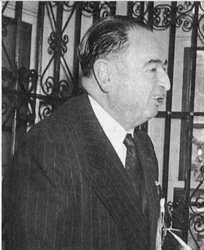
Malgrat la fòbia anticatalana de Lequerica (foto), Francesc Cambó va col·laborar obertament amb ell a l'hora de donar informacions sobre els moviments d'alguns líders polítics republicans a l'exili.

Els referents eren, o haurien d'haver estat, immillorables. Cambó havia assessorat diverses multinacionals, en especial nord-americanes, perquè “es fiessin” del general Franco, havia escrit dos articles compromesos a la premsa internacional – The Sunday Telegraph de Londres i La Nación de Buenos Aires– i havia inspirat una declaració de suport de 100 empresaris, intel·lectuals i polítics catalans al general Franco, l'octubre de 1936, just quan aquest era nomenat jefe de estado i la FAI