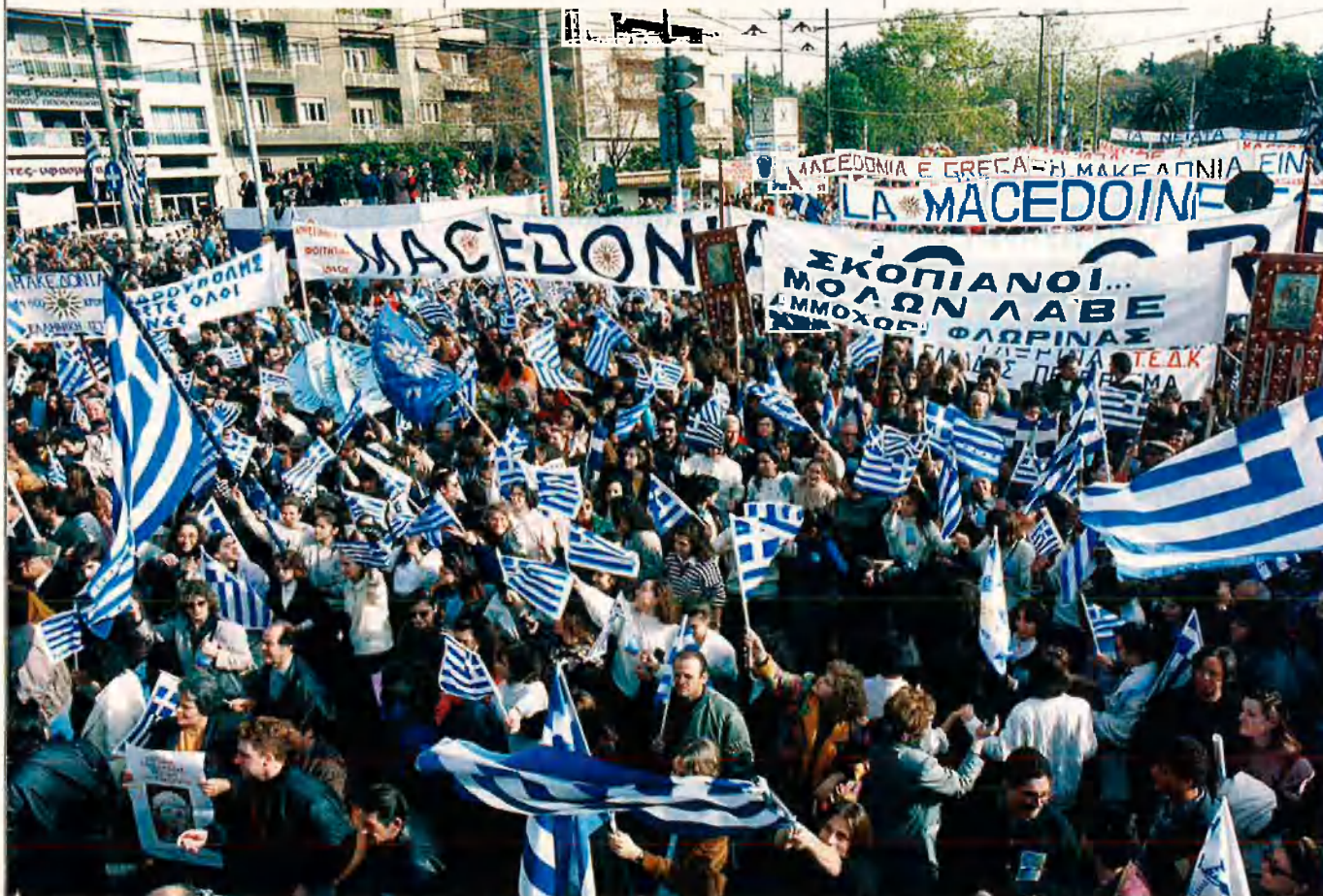
L'adopció del nom i dels símbols de Macedònia per part de la república ex-iugoslava ha despertat mobilitzacions multitudinàries de rebuig a Grècia.

Fa quinze dies, a l'altra frontera, més de deu mil albanesos eren retornats per la força a Albània com a resposta a l'expulsió, per part d'Albània, d'un sacerdot ortodox grec que, segons sembla, repartia propaganda nacionalista entre els grecs d'Albània. Durant mesos Grècia ha blocat el reconeixement per part de la CE de la nova Macedònia. I tot amb el rerefons permanent de la violència anti-turca i el conflicte obert des de sempre entre aquests dos estats. Conflicte que, significativament, va fer aliats durant un temps búlgars i grecs contra els turcs. I cal re-