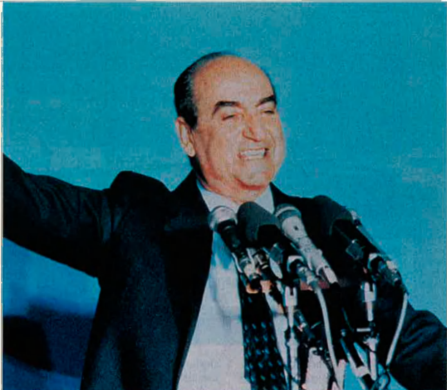
La política internacional de Grècia (en la foto, el president Mitsotakis) està molt influïda per les peculiars i perilloses relacions que aquest país té amb els seus veïns.

Quan George Bush va anar a Atenes el 1991, hi va fer un discurs de vint-i-dos minuts. Es tractava d'una adulació constant als seus hostes: "Grècia, bressol de