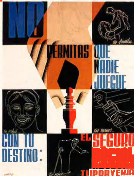
Cartell de publicitat No permitas que nadie juegue con tu destino , Mèxic, 1947.

Tot un altre apartat, titulat "Apunts solts", és degut a un costum molt arrelat en l'autor de The American Way of Life . Renau sovint escrivia en mitges quartilles, tipus fitxa, els pensaments que se li ocorrien o les anotacions que feia en preparar un llibre o un article, o qualsevol altre projecte seu. Totes aquestes fitxes manuscrites, disperses, inconnexes, sumen centenars de pàgines de lletra me-