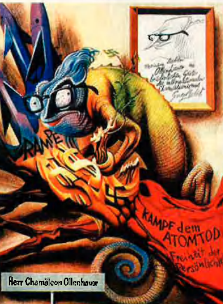
Herr Chamäleon Ollenhauer

obra, sobretot de les pintures murals alemanyes dels anys setanta, i en particular del mural El futur treballador del comunisme . Amb tot, l'apartat més important d'aquesta secció és una gegantina col·lecció de "negatius", al voltant de 15.000. Contenen fotografies dels seus fotomuntatges, cartells polítics, de cine i de publicitat, els murals mexicans i alemanys i obres molt menys conegudes, com Die 10 Gebote ('Els deu manaments'), pel·lícula animada per a la televisió de la RDA, curt-metratges per al cinema mexicà, els olis dels anys quaranta (amb forta influència picassiana), o els gravats per al volum El libro del mar , la portada de la revista Lux , etc. També apareix fotografiat Renau, sobretot a Mèxic, amb la