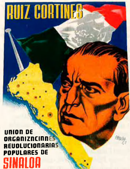
Cartell polític Ruiz Cortines , Mèxic, 1951

La secció "Documentació" engloba exclusivament materials escrits o susceptibles de ser transcrits a paper, com ara les gravacions magnetofòniques. El primer apartat s'anomena "Llibres" i hi apareixen els esborranyos originals de Fata Morgana: The American Way of Life , els quals permeten reconstruir el pla original d'aquesta obra. Ací està també un dels projectes que Renau deixà inacabat, el