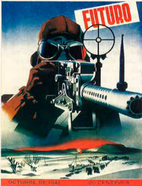
Portada de la revista Futuro , Mèxic, 1941.