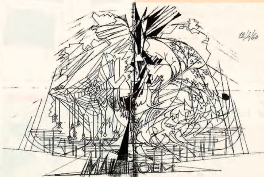
Esborrany per al cartell mural Mai Poem , realitzat al seu estudi de Berlín el 1960.

L'arxiu d'imatges era en essència un taller de fotomuntatges, o amb més precisió, el magatzem on s'arxiven milers de fotografies fins al moment en què eren requerides per compondre un fotomuntatge, però també per subministrar informació visual per a una pintura mural o per a qualsevol altra necessitat. Renau classificà les imatges segons unes matèries predeterminades, les quals codificà mitjançant números que anaven del 0 al 9. Si volia afegir major precisió a la classificació, dividia cada número en uns altres deu apartats i així successivament. El número 3, per exemple, estava subdividit en desenes (30, 31, 32...), el 31 en centenes (310, 311, 312...), i així fins que calia. Les deu principals matèries eren les següents: 0.- Cosmos. 1.- Geografia. 2.- Vida (Biologia). 3.- Homes. 4.- Pobles. 5.- Societat. 6.- Religió. 7.- Estat. 8.- Tècnica i 9.- Cultura. A. F.