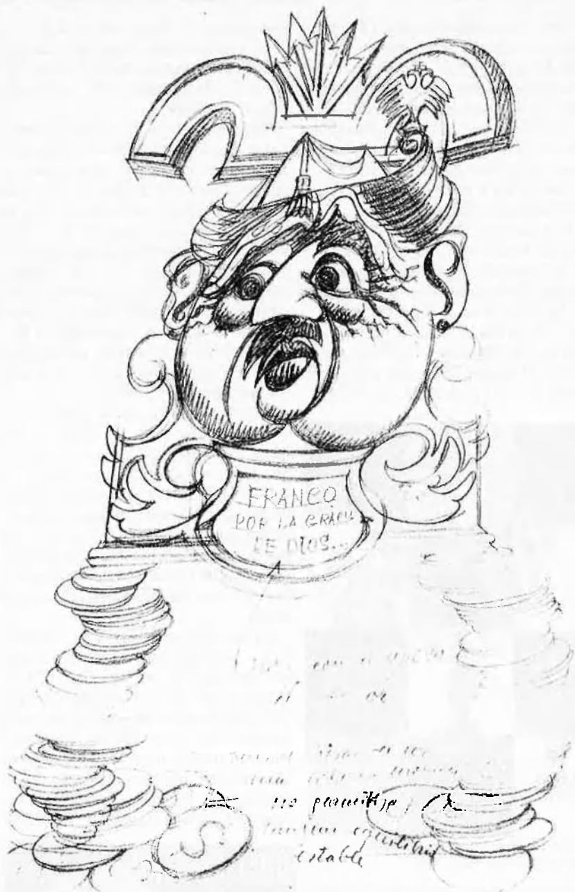
Esborrany per al fotomuntatge Franco por la gracia de Dios... Els centenars d'esborranys que conté l'arxiu Renau són una font indispensable per a l'estudi de la seua obra.