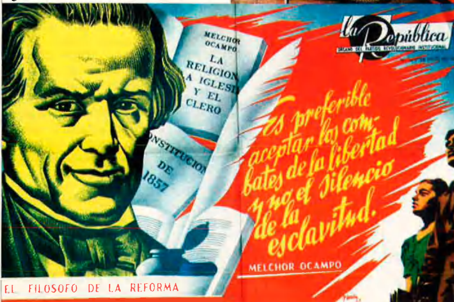
EL FILOSOFO DE LA REFORMA