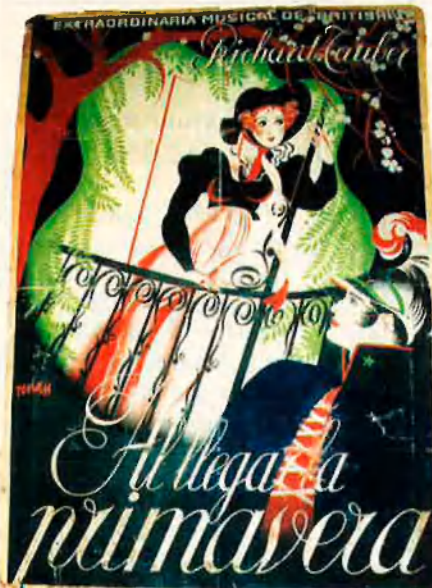
Cartell per a la pel·lícula Al llegar la primavera , realitzat a València el 1929.