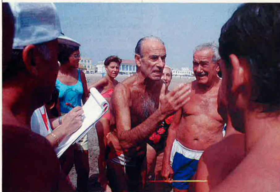
L'endemà de l'accident, la platja de Les Arenes era plena de gent que parlava dels fets i en buscava les més diverses interpretacions.