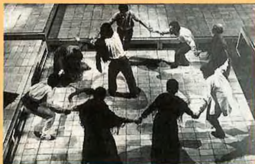
Camí de nit , estrenat el desembre del 1976.

màxima solidesa i del seu mètode rigorós i apassionat el Lliure es forjara el seu pòsit d'èxits i a la vegada contribuïa a donar prestigi al teatre català. Un prestigi que, per exemple, va fer de coixí a la presentació de Josep M. Flotats a Catalunya, després dels seus primers anys a la Comédie Française. Al 1978 el Lliure presentava La vida del rei Eduard II d'Anglaterra , un muntatge dirigit per Pasqual i protagonitzat per Flotats. Sense una presentació