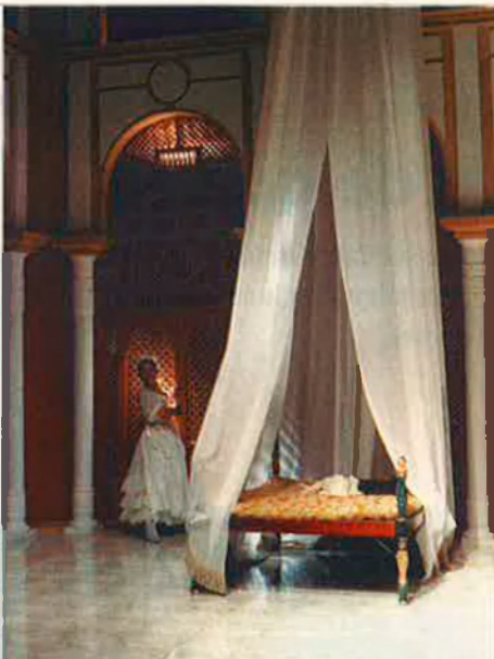
Dalt, Les noces de Figaro , 1989. Baix, El balcó , 1980.

La signatura del conveni, prevista per al febrer d'enguany, va ser ajornada. La cita següent era per al 4 de juny, dos dies