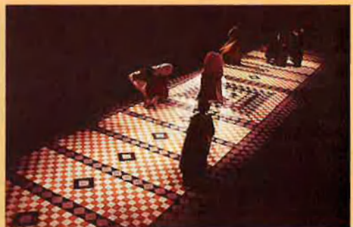
Titus Andrònic , 1977.

1978. Josep Maria Flotats protagonitza Eduard II d'Anglaterra en una actuació