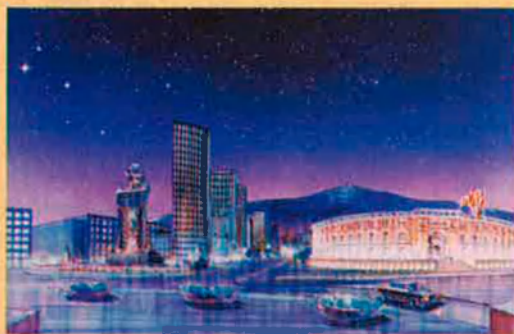
Projecte arquitectònic de Les Arenes, del 1988.

remodelació de Les Arenes com a paradigma de teatre nou. Es crea la Fundació i el Lliure entra a formar part de la Unió dels Teatres d'Europa. Lluís Pasqual marxa a l'Odéon de París.