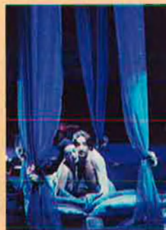
La bella Helena , 1973.

1981. El muntatge d' Operació Ubú , dirigit per Boadella, esdevé polèmic per la sàtira evident envers la figura de Jordi Pujol.