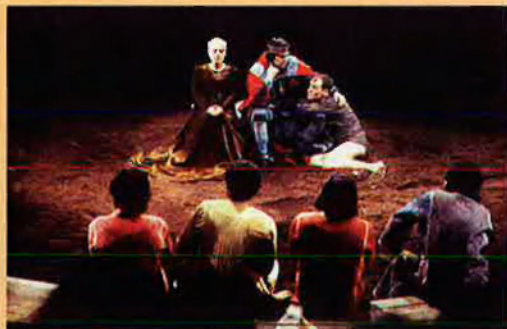
Eduard II d'Anglaterra , 1978.

A l'abril del 1991, un Fabià ja malalt que desafiava tots els pronòstics dels metges, presentava públicament la maqueta del projecte de Manuel Núñez (au-