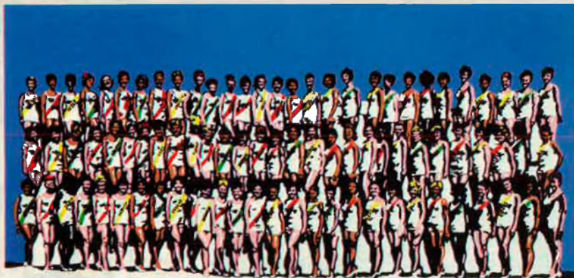
Miss amb vestit de bany, 1970.