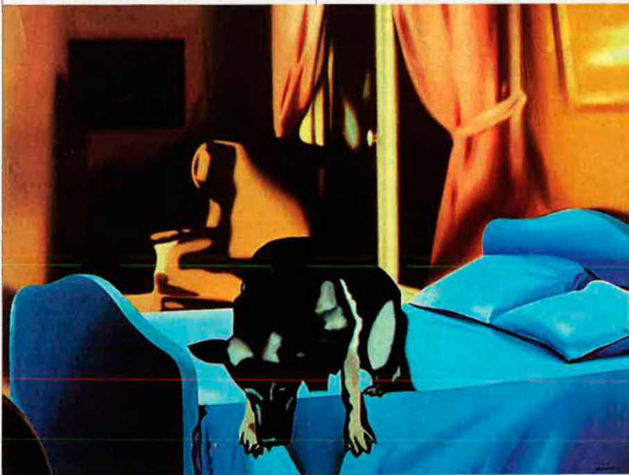
Pastor alemany contagiad de l'angoixa existencial en dormitori matrimonial comprat en uns grans magatzems, 1972.

A principis dels 70, l'Equip Realitat abandonava la línia avantguardista sota la qual havia militat fins a aquell moment per definir-se, en el seu estil creatiu, d'una manera més particular. En definitiva, Ballester i Cardells no feien una altra cosa que seguir el fenomen que s'estava produint a Europa. I és que a principis d'aquesta dècada, els pintors que derivaven de la Nova Figuració, van prendre, cadascú, la seua via pròpia. Ho havien fet, anteriorment, De Chirico o Picabia; i, ara, els artistes ho reivindicaven. Com també reivindicaven, dit siga de pas, l'ofici de pintor, fet que els oposava a les actituds anarquitzants dels camins que va marcar en el seu moment Marcel Duchamp i que ara eren seguits pels neodadaïstes. No pretenien, els pintors derivats de la Nova Figuració, establir de nou un ordre dins l'àmbit de les arts, sinó que qüestionaven les maneres d'enfocar l'activitat pictòrica. Per aquestes raons, el