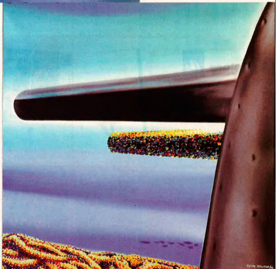
Composició: els canons del creuer republicà Libertad, el 1937, 1975. ARXIU