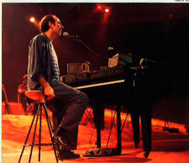
Lluís Llach. El músic hi va presentar el seu darrer disc.

És per això que l'espectacle és recomanable per a tots aquells que no són assidus a les convocatòries pancatalanistes. Els Octubre són una operació integradora, oposen a totes les remors de capsigranyament una sana vitalitat. Qui no es rendeix davant d'unes jornades lul·lianes, com les