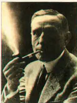
Pompeu Fabra. Una obsessió pel règim.