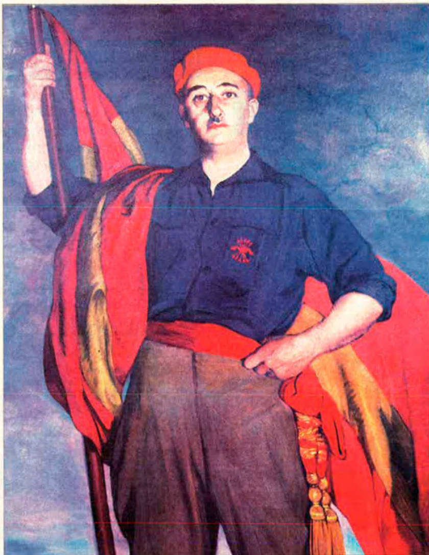
El franquisme va lluitar intel·ligentment contra la llengua. El règim va impedir l'adaptació del català a l'activitat dels mitjans de comunicació.