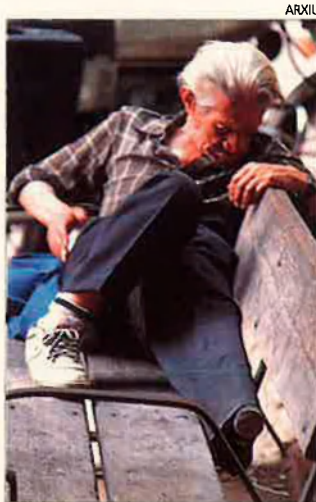
Cada volta hi ha més treball per a les ONG.

Realitzen programes de desenvolupament educatiu al Tercer Món; tant si són programes propis com a petició d'ONG del sud, en el qual cas ofereixen finançament i assistència tècnica. Envien cooperadors i professional de l'educació.