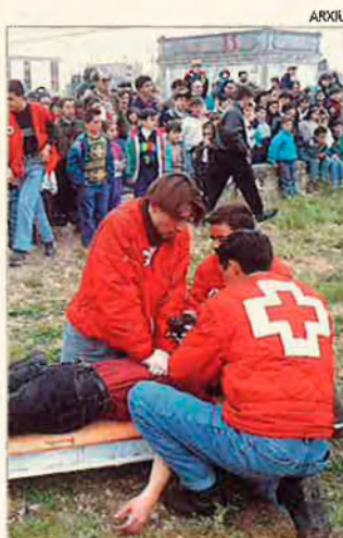
La Creu Roja s'ha convertit en símbol de treball en dures condicions.

Educació sense Fronteres. Anselm Clavé 6, 1r, 1a. Barcelona. 93-412 72 17.