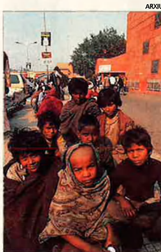
Els països més pobres també tenen les seues ONG.