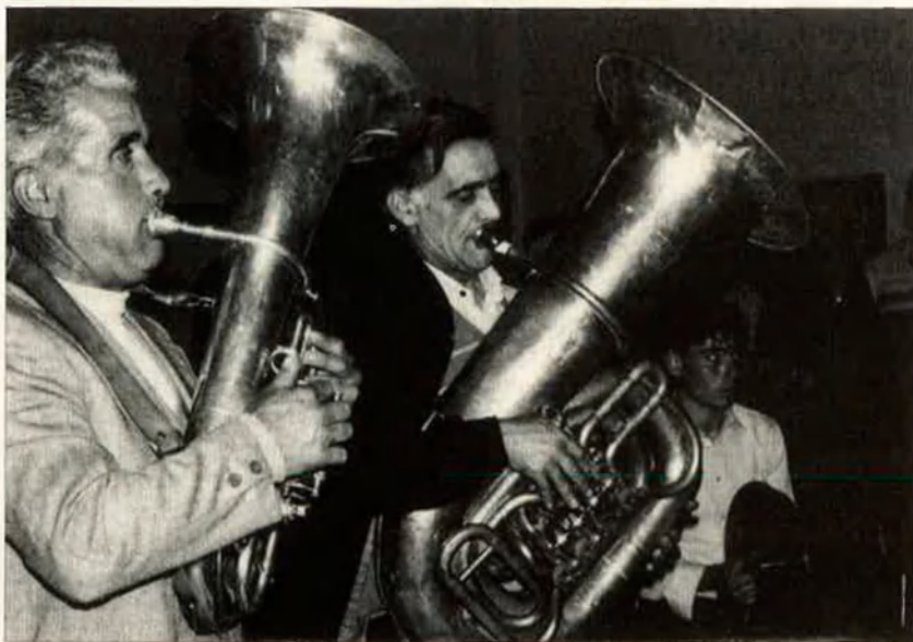
La dificultat del treball de camp. Tanmateix, aquesta tasca contrasta amb la predisposició dels enquestats.

d'Albaida, popularment conegudes com "dances".