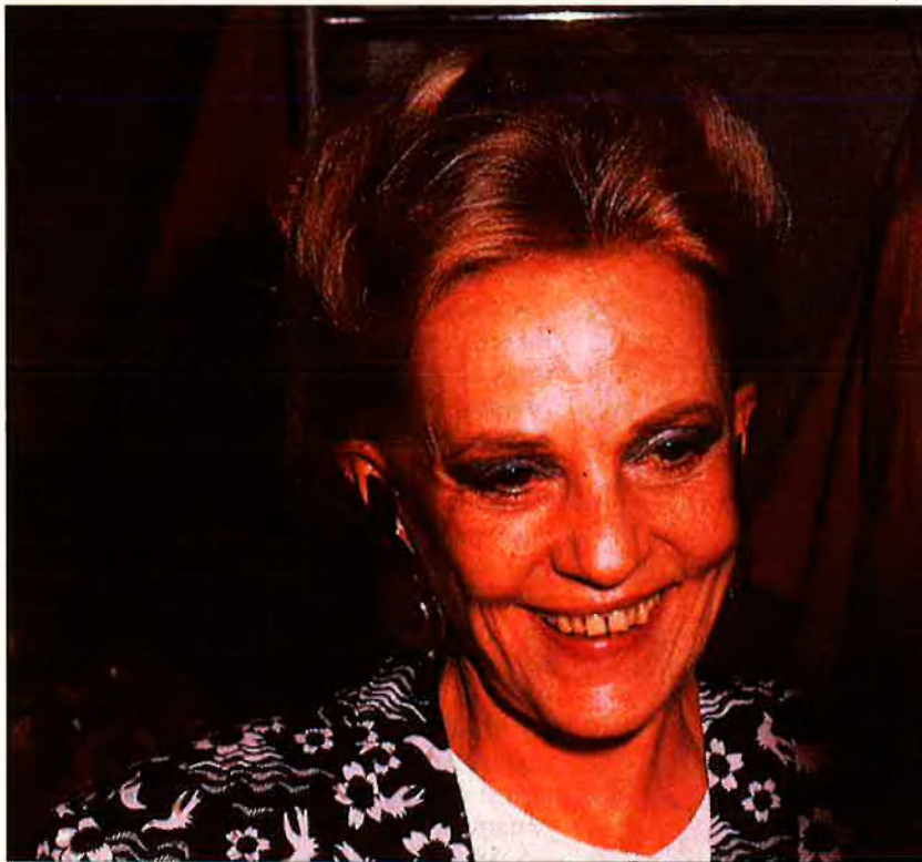
Jeanne Moreau. El fet de ser actriu ha marcat la seva vida, però mai no ho ha significat tot per a ella.

Actualment, Jeanne Moreau viu a París. Però, prescindint de la seva fallida experiència matrimonial, l'actriu adora els Estats Units i no suporta els europeus que en parlen amb menyspreu. "Quan sento que els europeus parlen dels americans , jo els dic: 'No en sabeu res, dels americans '. És un país increïble, potser per causa dels seus orígens. És com una terra santa, un nou Jerusalem. Cada cop que camino pels carrers de Boston, Baltimore, Washington o Nova York, m'emociono. Tot-hom és tan... diferent. Tot s'hi barreja."