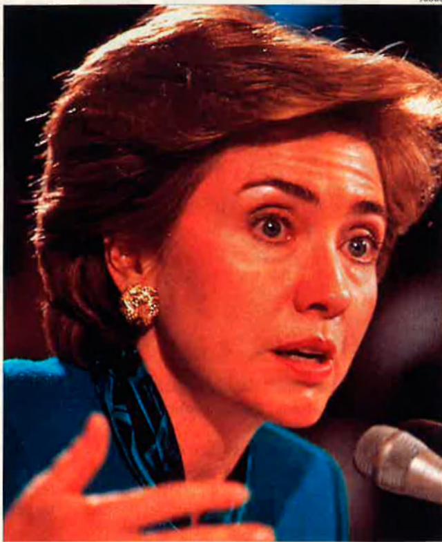
Hillary Rodham. El matrimoni Clinton passa, de nou, per hores baixes.

Un exemple. La nit de dimarts diversos informatius nord-americans recollien el cas dels missatgers de Rose Law, l'empresa d'advocats on havia treballat Hillary. Aquests missatgers declaraven a tothom que havien rebut l'encàrrec poc després de començar la campanya electoral, i quan Hillary havia deixat l'oficina, de cremar papers, caixes de papers, pertanyents a la primera dama. Sorprèn que tinga res d'estrany això. És més que dubtós que siga incorrecte que, quan una persona abandona la seua oficina, l'empresa es desfaça dels seus papers. Però en l'ambient actual això es torna en la insinuació que