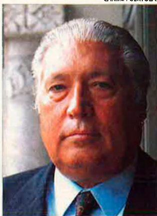
Macià Alavedra, conseller d'Economia de la Generalitat de Catalunya. Ha anunciat la voluntat de ser candidat a l'alcaldia.