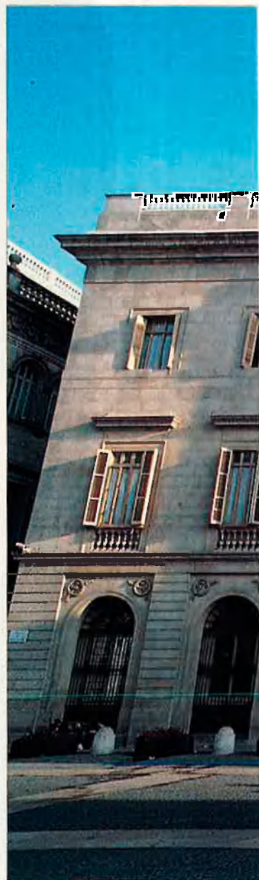
L'Ajuntament de Barcelona ha estat negat quatre vegades al partit de Pujol. CiU provarà de prendre la plaça a Pasqual Maragall en les municipals del 95.