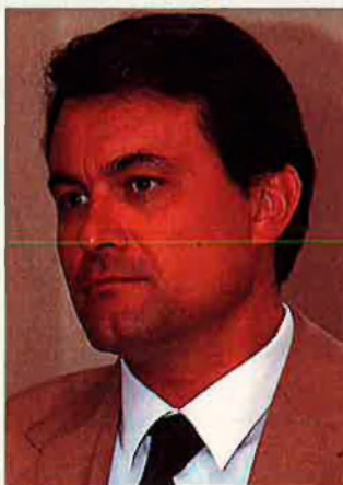
Artur Mas, cap de l'oposició de CiU a l'Ajuntament de Barcelona. Ha guanyat credibilitat i suport al si de CDC.

candidat de CiU a l'Ajuntament de Barcelona quan Jordi Pujol li ho va demanar. Era l'any 91 i en la política espanyola hi havia molt de terreny a córrer i les possibilitats de sortir aïrós de la batalla de Barcelona eren més que remotes. Aquella negativa fou considerada per alguns observadors com una de les primeres causes de la crisi Pujol-Roca, que esclatà pocs mesos després. Roca aquesta vegada és conscient que no pot dir que no, si el president de la Generalitat li ho torna a demanar. Dues negatives seria excessiu. Però també hi ha un segon factor que inclina Roca a mirar amb bons ulls la possibilitat de ser candidat a l'alcaldia. Les perspectives en la política espanyola sembla que es vagin tancant cada dia que passa. El sostre de col·laboració actual amb el Govern del PSOE no sembla pas que pugui ser superat amb una implicació superior de CiU en el govern de l'estat; més aviat al contrari. El relleu del PSOE, el PP, encara plau menys a Roca i, per tant, l'alcaldia de Barcelona pot ser un bon càrrec per a una persona que, tot i la llarga carrera política, no ha tingut mai un càrrec institucional de primer ordre.