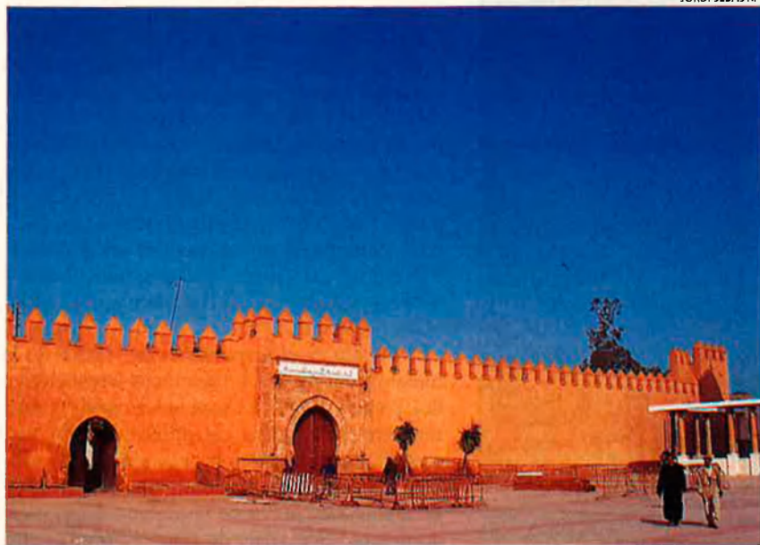
Settat, vila agrícola en reconversió. El poble ha rehabilitat la seua arquitectura tradicional.