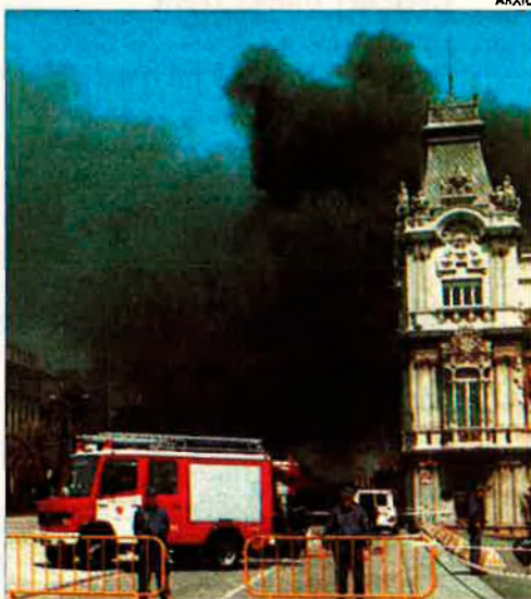
Atemptat d'ETA a Barcelona.

"Hi ha vint-i-cinc mil porcs amagats a cases i pisos de l'Havana, criats de forma il·legal, amb les cordes vocals tallades a fi que no grunyin. Porc més o menys, això pot ser una estadística, però la mala salut de Fidel Castro fins ara només és un rumor."