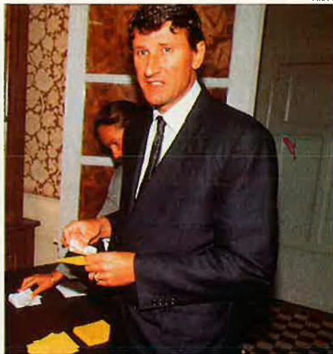
Philippe De Villiers.

"La Constitució diu ben clar que el president del Govern pot dur al Congrés de Diputats la qüestió de confiança sobre el seu programa o sobre una declaració de política general. Però ara, després del gran vot de càstig que el Govern socialista ha rebut a les eleccions europees, la qüestió és la desconfiança de Jordi Pujol, que s'estima més donar per fet que encara dóna la confiança a Felipe González que tornar a votar-la una vegada més."