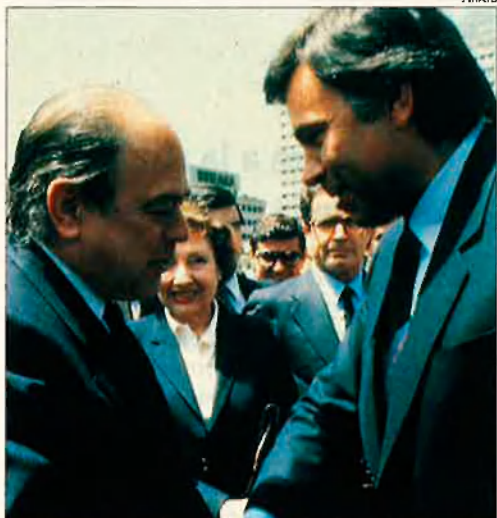
Felipe González i Jordi Pujol.

vergència –deixem de banda Unió Democràtica– no li vol donar suport de forma explícita. Vet aquí un tema per a Ionesco: mantenc els meus vots, faig alguna reforma econòmica, contenc la pujada d'IU però tot això sense dir-li a ningú que encara sostenc el Govern. No sé si mai arribarem a comprendre la verdadera dimensió de la desconfiança com una versió convergent de la cripto-confiança.