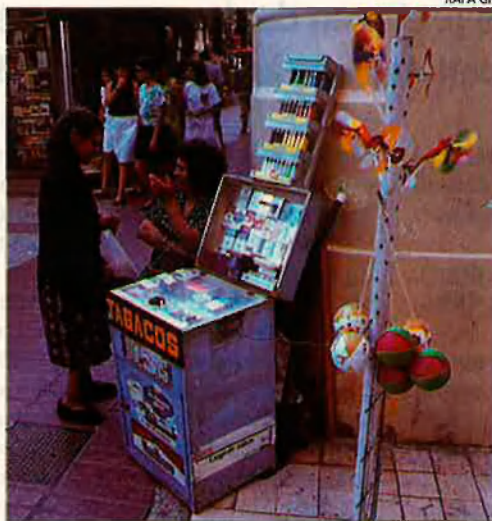
Els fumadors són persones altruistes.

impostos. Pel que fa a Espanya, paguem més com més cares són les cigarretes, al contrari d'altres països europeus on el fumador paga més com més cigarretes fuma. Sigui com sigui, és una prova d'immensa barbàrie que els fumadors —gent pacífica i de bonhomia— avui per avui encara no ens hem decidit a portar al tribunal d'Estrasburg.