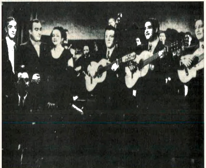
Agustín Lara, Pedro Vargas i Tona la Negra alternant amb Los Panchos en 1948. La difusió del bolero per terres mexicanes fou fulgurant.