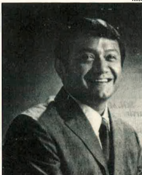
Armando Manzanero. Aquest mexicà, que també compon cançons lleugeres per a altres artistes, forma part de la nova generació de boleristes.

Els anys de decadència. La consolidació del rock and roll entre les noves generacions i la substitució dels ideals romàntics de l'amor per una concepció més pragmàtica i igualitària de les relacions de parella a final de la dècada dels seixanta van determinar el