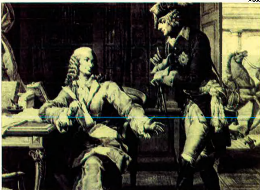
Les relacions entre Frederic II de Prússia i Voltaire. L'erudit francès va residir dos anys a la Cort del monarca il·lustrat.

losòfiques –com, a la seua manera, fa Montesquieu en les Cartes perses –. Centra l'atenció en el sistema polític parlamentari del qual emana un clima candorós que es repeteix, òbviament, en els àmbits religiós i econòmic.