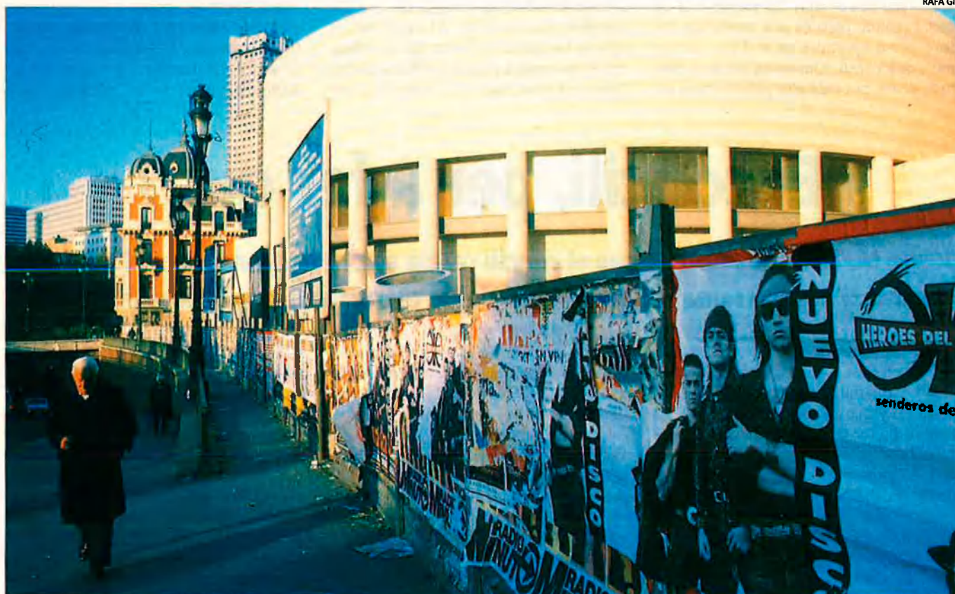
El Partit Popular ha proposat la signatura d'un segon pacte autonòmic -per les autonomies de l'article 151- en el debat sobre les autonomies del Senat (foto). Aquest intent ha despertat molts recels entre files nacionalistes.