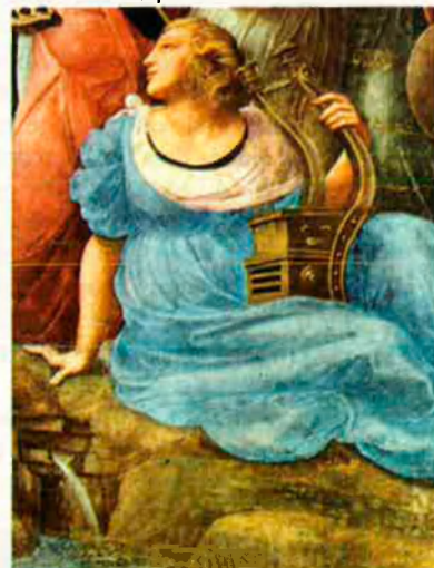
ESTANÇA DE LA SIGNATURA / RAFAEL