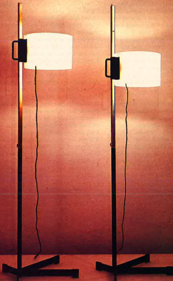
Llum 'TMC' de Miquel Milà. 1961.