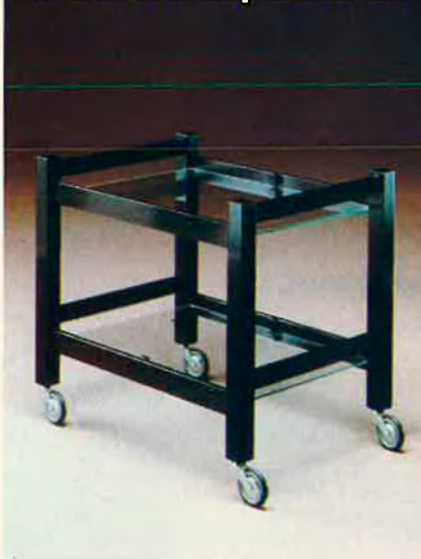
Carret de te de Miquel Milà. 1967.