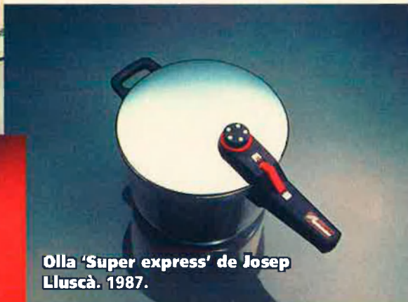
Olla 'Super express' de Josep Llusçà. 1987.