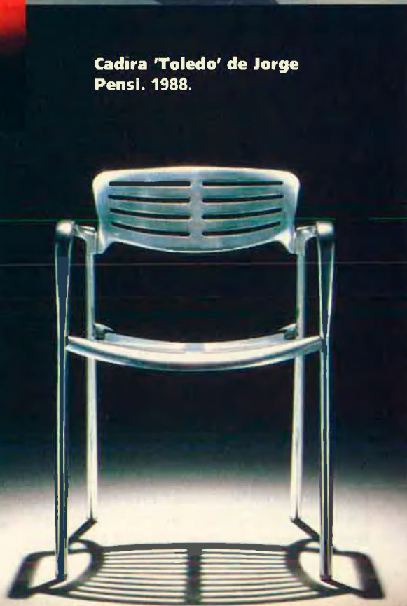
Cadira 'Toledo' de Jorge Pensi. 1988.