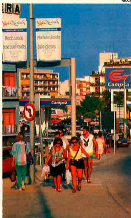
El turisme mafiós rus visita el nostre país. El seus diners emmirallen.

“Encara que no ho sembli, aquesta gent porta virolla —m'explicava un joier amb botiga a Lloret—. No s'hi miren gaire a gastar i compren de tot i força. N'estem encantats, aquesta és la veritat”. Els empresaris del sector turístic no paren de fregar-se les mans, quan en parlen. Ho fan amb la tècnica dels experts. Les riuades de turistes provinents de l'Est han anat en augment de forma progressiva, aquestes últimes temporades. I les previsions d'enguany són millors que mai no ho han sigut fins ara. Tots estan disposats a no perdre passada. Això raja.