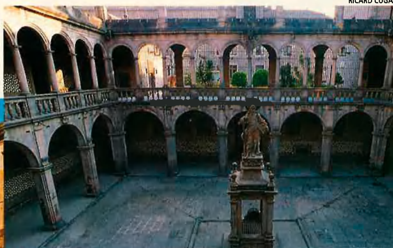
Dues imatges del pati de la Casa de la Convalescència, seu del IEC. L'Institut es debat entre el canvi o la continuïtat.

programa fins a la seva consecució, és a dir, en garanteix el finançament, cosa que seria difícil de fer des de les seccions”.