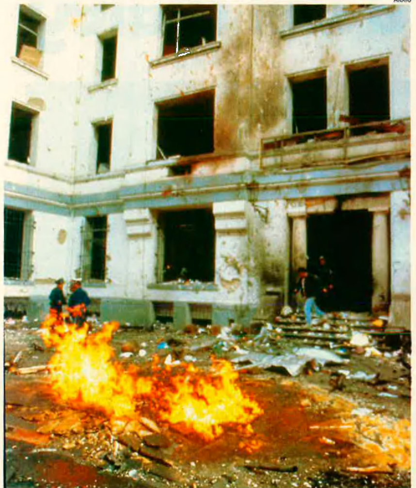
Atemptat del 30-1-95 comès pel GIA. La branca més incontrolada del FIS s'oposa a qualsevol pacte amb els militars que governen Algèria.

Les negociacions amb el FIS marquen un nou rumb del conflicte algerià, després de la signatura, el gener d'enguany, de la plataforma de Roma, o contracte nacional algerià, que estableix les bases del retorn a la democràcia; alhora, reconeix que el país és hereu de la revolta de l'any 1954 contra els francesos.