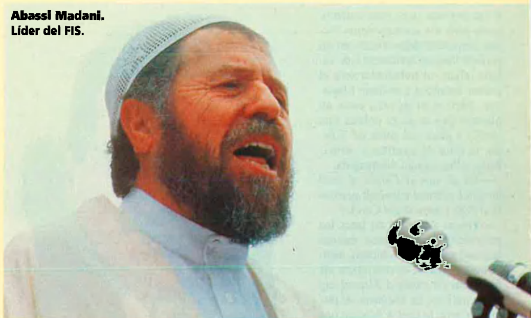
Abassi Madani. Líder del FIS.

La certesa que un partit islamista radical governaria Algèria, l'any 1992, va fer que el poder militar interrompés el procés electoral. Avui, la violència que generà aquell colp exigeix un gest per la pau.